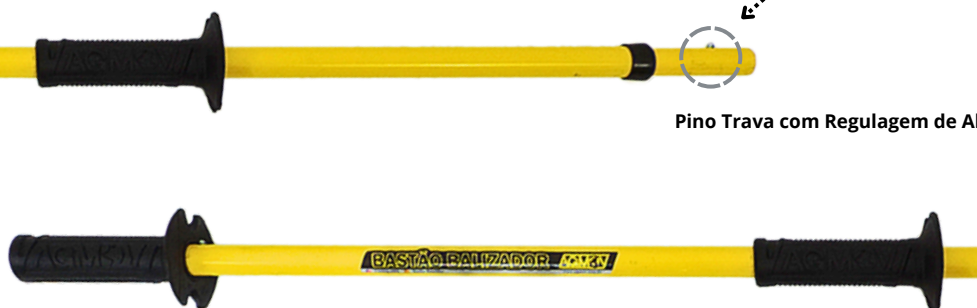
Manopla de punho emborrachada - anatômica e antiderrapante