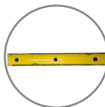
Pino Trava com Regulagem de Abertura