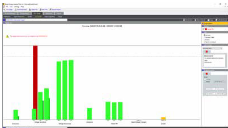
Fluke Energy Analyze Plus: Resumo do estado de saúde da qualidade da potência