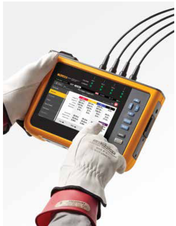
Navegue facilmente através do ecrã tátil a cores de grandes dimensões

Ao transferir dados dos analisadores de qualidade de potência da série Fluke 1770, o pacote de software Energy Analyze Plus incluído pode comparar os dados estatísticos medidos de tensão e de harmónicos de corrente com as exigências de diferentes normas como, por exemplo, a EN 50160 ou a IEEE 519, para determinar se excedem os limites de conformidade. Esta potente funcionalidade de manutenção preditiva permite que os harmónicos de corrente sejam observados antes de surgir distorção na tensão, o que permite evitar falhas inesperadas ou situações de não conformidade e aumentar o tempo de atividade do sistema. Com a proliferação de cargas e geração de energia baseadas em inversores, manter os harmónicos de corrente sob controlo está a tornar-se cada vez mais vital para garantir uma qualidade fiável da potência e evitar tempo de inatividade do sistema.