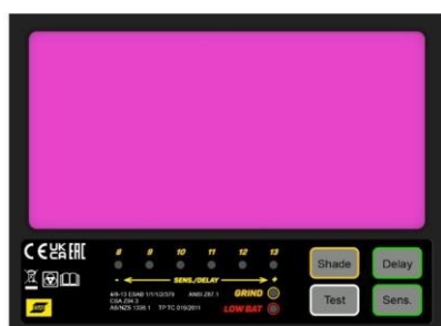
Novo display LED multi-color